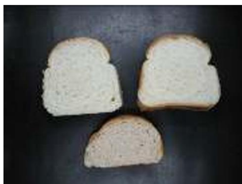
Gambar 2. Karakteristik Fisik Roti 100% tepung gandum tanpa enzim, roti 100% tepung gandum dengan enzim, dan roti tepung sorgum dan gandum (30:70) dengan enzim

Perbedaan fisik pada roti sorgum terutama terlihat pada volume dan struktur pori. Adonan roti tepung sorgum dan gandum (30:70) dengan enzim masih memiliki pengembangan volume yang lebih rendah dibandingkan adonan roti 100% tepung gandum. Irisan roti tepung sorgum dan gandum juga menunjukkan keseragaman pori dan volume yang lebih rendah dibandingkan roti 100% tepung gandum. Hal ini menunjukkan bahwa penggunaan enzim dapat membantu memperbaiki sebagian kecil dari kelemahan roti sorgum dan gandum, namun belum sepenuhnya menyetarakan karakteristik fisik dan sensorisnya dengan roti berbasis 100% tepung gandum (Lembong et al., 2017).