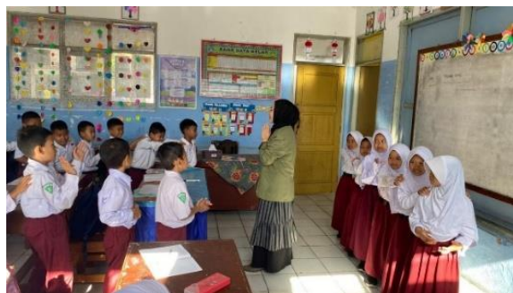
Gambar 2. Praktik afirmasi positif anti-bullying siswa kelas II SDN Pasirhayam

Hasil penelitian menunjukkan bahwa pembiasaan menepuk bahu teman sambil mengucapkan afirmasi positif memberikan dampak positif terhadap interaksi sosial siswa SDN Pasirhayam. Kegiatan ini dilaksanakan secara rutim pada akhir pembelajaran dan dipandu oleh mahasiswa PLP.