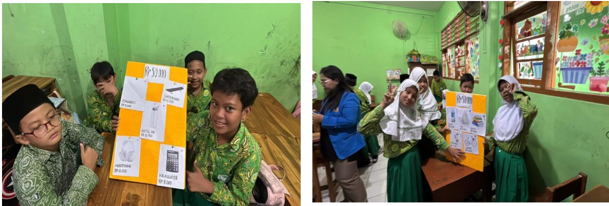
Gambar 2 Hasil Permainan Edukatif Peserta PKM

Pembahasan hasil penelitian ini menegaskan bahwa pendekatan permainan edukatif tidak hanya berfungsi sebagai media pembelajaran, tetapi juga sebagai sarana pembentukan kebiasaan manajemen keuangan sejak dini. Signifikansi temuan terletak pada kemampuannya menghubungkan konsep keuangan dengan pengalaman nyata siswa, sehingga pembelajaran menjadi lebih relevan dan aplikatif. Dengan demikian, permainan edukatif kebutuhan dan keinginan dapat menjadi alternatif strategi pembelajaran yang efektif dalam menanamkan dasar-dasar manajemen keuangan dan jiwa kewirausahaan pada siswa sekolah dasar.