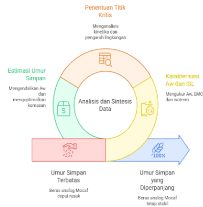
Gambar 3. Prosedur Analisis Sintetis