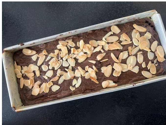
Gambar 1. Produk Brownies Daun Katuk dengan Substitusi Gula Aren

Uji sensoris dilakukan untuk menggambarkan karakteristik sensori secara lebih spesifik, meliputi warna, rasa, aroma, tekstur, aftertaste, dan overall (keseluruhan).