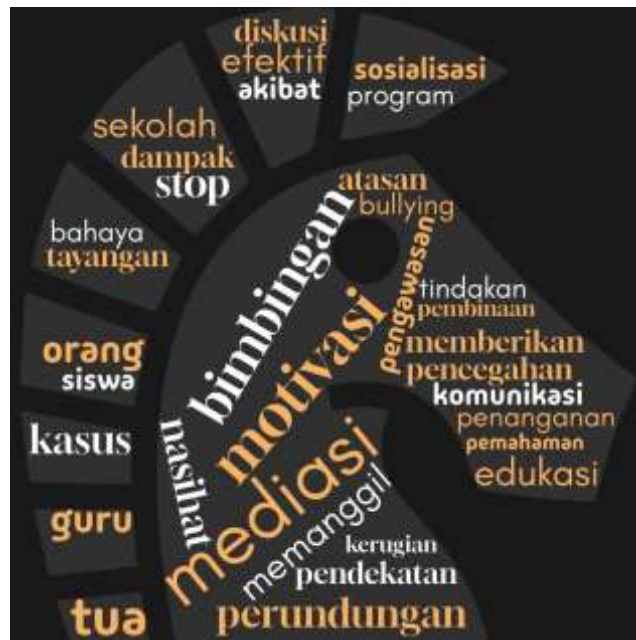
Gambar 1. Word Cloud Hasil Kuisisioner Guru tentang Penanganan Perundungan di Sekolah.

Gambar 1 adalah penjelasan upaya penanganan perundungan di sekolah. kata yang paling dominan seperti bimbingan, mediasi, motivasi, pencegahan, dan edukasi menunjukkan bahwa guru berperan aktif dalam menangani perundungan melalui pendekatan yang mendidik dan membangun. Upaya yang dilakukan tidak hanya bersifat hukuman, tetapi mencakup pembinaan, pemberian nasihat, serta peningkatan kesadaran siswa. Selain itu, munculnya istilah seperti diskusi efektif, sosialisasi program, dan pemanggilan orang tua, mencerminkan adanya kolaborasi antar guru, siswa dan pihak sekolah. Hal ini menggambarkan praktik komunikasi permasalahan, sehingga penanganan perundungan di sekolah lebih fokus pada komunikasi yang mendukung serta mendorong perubahan perilaku positif pada peserta didik.