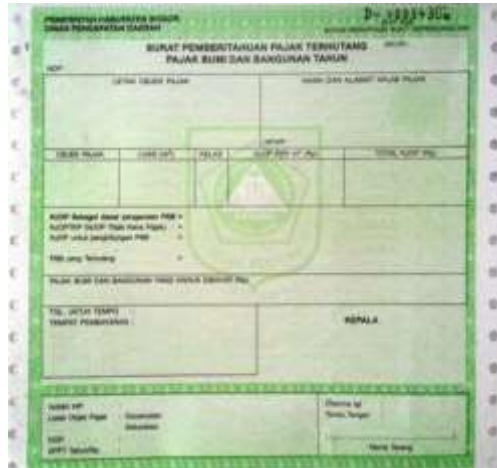
Gambar 3.1 Surat Pemberitahuan Pajak Terutang (SPPT)