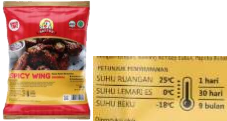
Gambar 1. Bartoz Spicy Wing Original

Berikut merupakan kemasan dan petunjuk penyimpanan Bartoz Spicy Wing original.