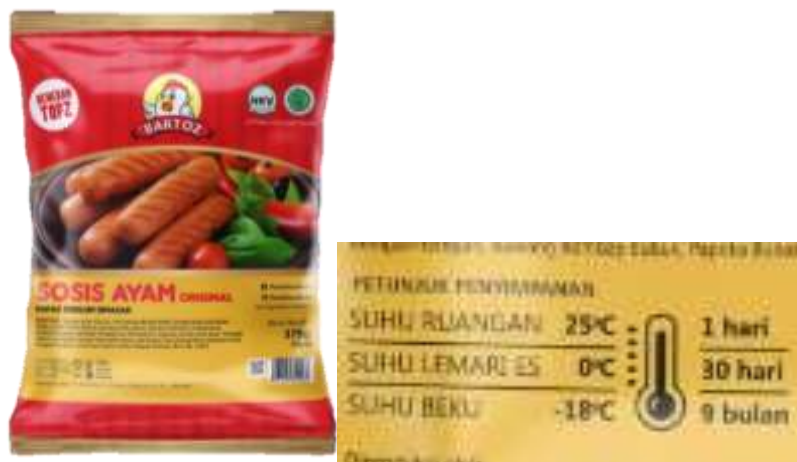
Gambar 2. Bartoz Sosis Ayam Original

Berikut merupakan kemasan dan cara penyimpanan Bartoz Sosis Ayam original.