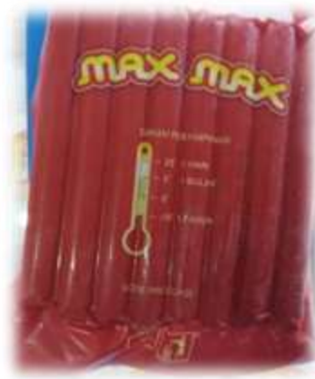
Gambar 1. Kemasan produk sosis