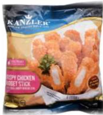
Gambar 2. Kemasan nugget ayam