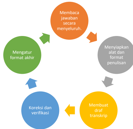
Langkah-langkah menganalisis transkripsi wawancara

jawaban dari narasumber menjadi suatu format teks yang tersusun dan sistematis. Dengan fokus pada bagaimana cara penggunaan Google Translate dalam pembelajaran bahasa Inggris guna meningkatkan kemampuan menulis mahasiswa.