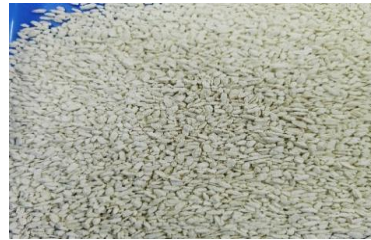
Gambar 3. Beras analog tepung sukun

Uji organoleptik dilakukan untuk mengetahui popularitas dan daya terima beras tepung sukun sebagai alternatif makanan yang tidak mengandung diabetes di masyarakat. Warna, bentuk, aroma, rasa, dan ketertarikan pelanggan tentang produk digunakan dalam uji hedonik. Gambar 1 menunjukkan gambar beras tepung sukun, dan Tabel 3 menunjukkan data tentang hasil uji hedonik yang dievaluasi dengan menggunakan teknik interval nilai mutu rata-rata.