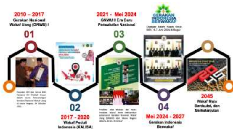
Gambar 2. Milestone Gerakan Indonesia Berwakaf

sumberdaya pengelola wakaf, pengelolaan wakaf secara produktif, dukungan teknologi dalam pengelolaan wakaf, serta kontribusi wakaf terhadap pembangunan nasional dan global. Hal-hal tersebut tertuang dalam peta jalan pengembangan wakaf nasional. Gerakan Indonesia Berwakaf memandang penting peran nazhir dan menekankan transformasi nazhir untuk dapat mewujudkan Gerakan Indonesia Berwakaf. Perbaikan kelembagaan menekankan pada kompetensi nazhir . Prasyarat yang harus ada untuk mewujudkan Gerakan Indonesia Berwakaf adalah gagasan, pemimpin, pemangku kepentingan ( stakeholders ), penanggung kepentingan bersama ( shareholders ), media, dan instrumen jaringan.