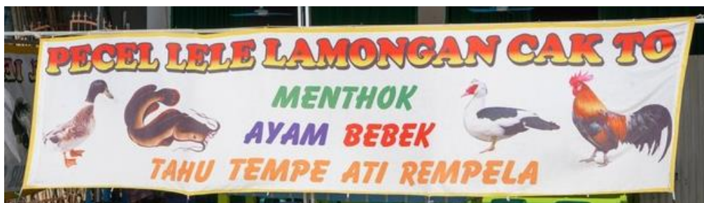
Gambar 1. Tipografi Vernakuler

Menurut Murtono (2014), tipografi vernakuler adalah suatu karya tulis yang inspirasinya pada kehidupan sehari-hari satu daerah dengan identitas untuk memberikan kesan akrab dan tradisional karena prosesnya terinspirasi dari nilai dan budaya lokal wilayah tersebut. Sedangkan menurut Nurabdiansyah (2017) tipografi vernakuler ialah perbendaharaan tradisi utamanya dalam bidang visual banyak ditemukan di jalan-jalan. Hal ini merupakan bagian kemajuan desain komunikasi visual yang khas. Tipografi vernakuler di spanduk warung tenda pecel lele ayam umumnya memakai warna gradasi ataupun hanya satu huruf warna mencolok yang diblok. Tak hanya itu, untuk menulis biasanya memakai tulisan kapital serta font serif . Tipografi vernakuler memiliki kegunaan sosial sebagai identitas usaha yang mempunyai persamaan berasal dari wilayah spesifik (Carella et al, 2017).