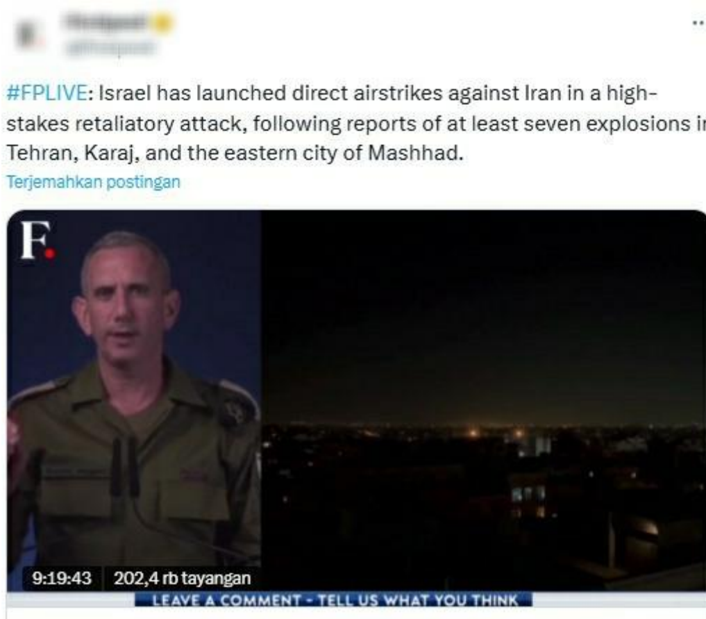
Gambar postingan X 3. Present Prefect

Dalam konteks yang paling dominan terletak pada konteks penggunaan penyampaian informasi berita. Banyak media-media berita yang menggunakan media sosial sebagai tempat penyampaian informasi sebab Media sosial bisa memudahkan individu maupun kelompok dalam mendapatkan dan menyebarkan informasi. (Susanti, 2021), dan penyampaian tersebut tidak terlepas dari present perfect .