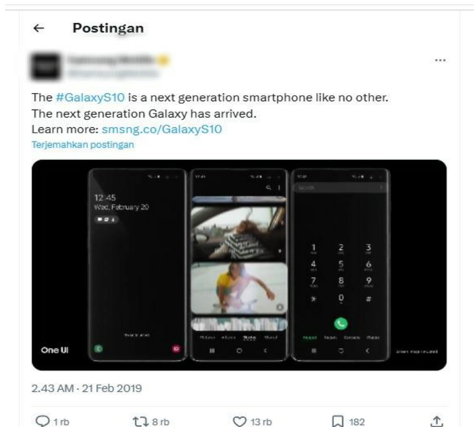
Gambar postingan X 2. Present Prefect

Dalam komunikasi sehari-hari di X, present perfect efektif dalam menciptakan kesan hubungan langsung antara masa lalu dan masa kini, yang sesuai dengan sifat real-time dari media sosial ini. Tense ini juga memungkinkan pengguna untuk mengungkapkan perasaan, pengalaman, dan situasi dengan lebih mendalam, yang mendorong audiens untuk memberikan respons. Menurut (Ridwan et al., 2024) Siapapun bisa menggunakan bahasa untuk memberi reaksi pada emosinya baik secara lisan maupun tulisan. Selain digunakan untuk mengutarakan pengalaman pribadi, present perfect juga sering digunakan dalam promosi iklan di media sosial, salahsatunya di platform X ini.