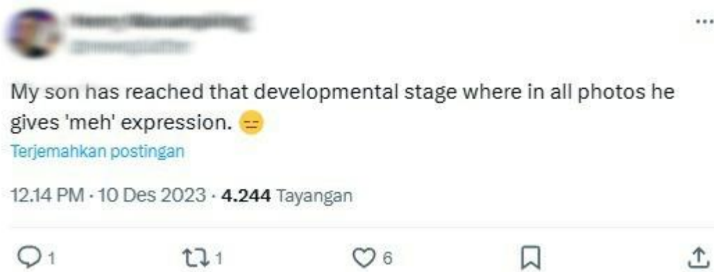
Gambar postingan X 1. Present Prefect

Dari hasil penelitian yang didapatkan, terdapat beberapa postingan yang menunjukkan penggunaan present perfect yang berhubungan dengan konteks tujuan penyampaian pesan di media sosial X.