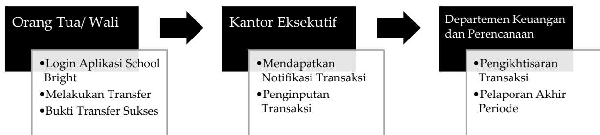
Gambar II Bagan Prosedur Penerimaan Kas dari Dana SPP