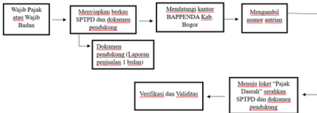
Gambar 3 Mekanisme Pelaporan Pajak Restoran Secara Offline