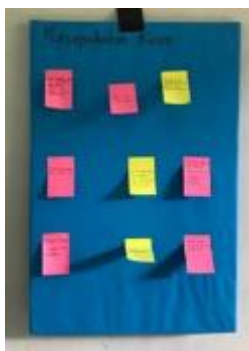
Gambar 8 Kesepakatan Kelas VI-C

Berikut adalah gambar kesepakatan kelas dengan berbagai macam aturan yang ditempel di dinding kelas.