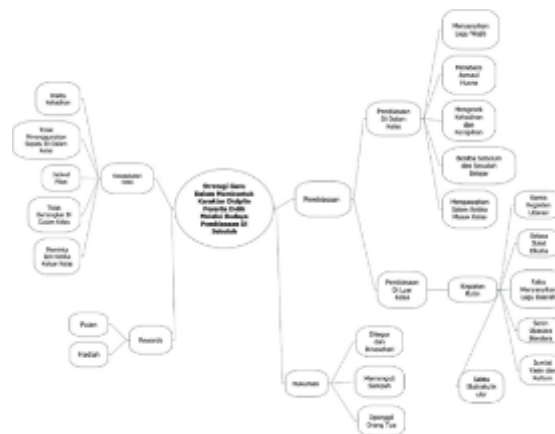
Gambar 7 Hasil Temuan Strategi Guru Dalam Membentuk Karakter Disiplin

Berikut di bawah ini gambar hasil temuan mind map dari strategi guru dalam membentuk karakter disiplin peserta didik.