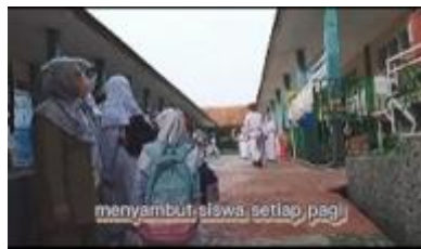
Gambar 4 Guru Menyambut peserta didik di Depan Gerbang

Adapun guru telah menunjukkan akhlak mulianya dengan menyambut peserta didik di depan gerbang dengan tujuan terbangunnya suasana harmonis antar guru dan peserta didik.