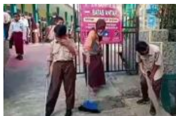
Gambar 6 Guru Dan peserta didik Membersihkan Lingkungan Sekolah

Dari hasil observasi menunjukkan bahwa warga sekolah SDN Batutulis 1 Bogor terutama guru kelas VI dan peserta didik kelas VI C selalu menjaga kebersihan lingkungan sekolah dengan membuang sampah pada tempatnya dan selalu melaksanakan piket kelas. Guru juga ikut berpartisipasi dalam kegiatan Jum'at bersih. Adapun guru telah menunjukkan tanggung jawabnya menjaga kebersihan lingkungan sekolah dengan ikut berpartisipasi membersihkan lingkungan sekolah sebagaimana pada gambar di bawah ini.