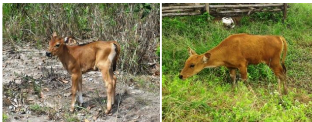
Gambar 2. Anakan sapi perlakuan P1 (kiri) dan perlakuan P2 (kanan)

Terdapat perbedaan yang nyata antara bobot anakan sapi pada perlakuan P1 dan P2 ( P < 0,05 ). Rataan bobot anakan sapi pada perlakuan P2 yang dilahirkan lebih tinggi dibandingkan perlakuan P1 sebesar 17,08 kg/ekor sedangkan rata-rata bobot anakan sapi P1 hanya sebesar 12,33 kg. Besar kecilnya bobot anakan sapi yang lahir dapat dipengaruhi oleh jenis kelamin anakan, jenis indukan serta pakan yang dikonsumsi. Menurut Prasojo et al , (2010) bahwa bobot lahir sapi sangat berpengaruh terhadap pertumbuhan anakan sapi, semakin besar bobot lahir maka kemampuan anakan sapi untuk bertahan hidup semakin baik. Secara fisik, anakan sapi yang dilahirkan pada perlakuan P2 mempunyai kondisi yang lebih baik dibandingkan P1 yakni anakan terlihat lincah dan bulunya mengkilap (Gambar 2).