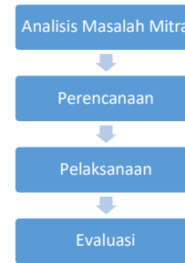
Gambar 1 Tahap Metode Rumah Belajar

Rumah Belajar di Desa Blumbangjaya dirancang sedemikian rupa melalui ragam tahapan. Berikut tahapan tersebut: