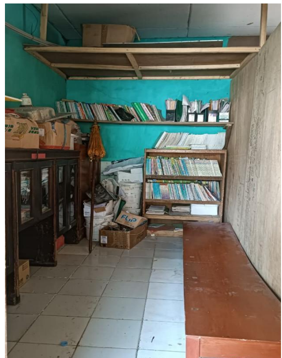
Gambar 3 Kondisi Awal Perpustakaan

Hasil identifikasi dan pemetaan masalah melalui wawancara serta observasi langsung menunjukkan bahwa kondisi perpustakaan MTs