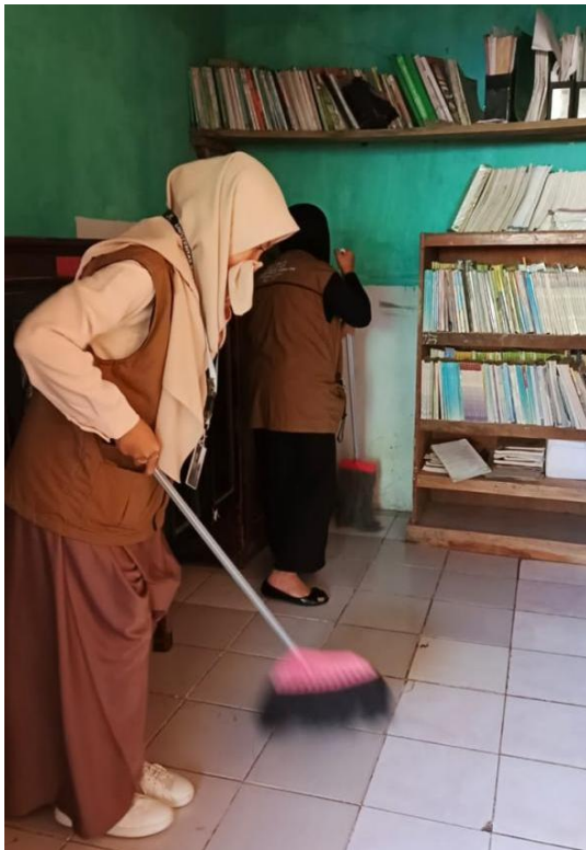
Gambar 4 Pembersihan dan Perapihan Perpustakaan

ditegaskan Kartika, Husni & Millah (2019) bahwa kualitas ruang belajar berpengaruh terhadap pengalaman belajar siswa. Dengan kondisi yang lebih layak, perpustakaan diharapkan dapat berfungsi optimal sebagai pusat sumber belajar sekaligus ruang literasi yang mendukung kegiatan akademik maupun non-akademik siswa. Adapun dokumentasi implementasi program ini dapat dilihat dalam gambar berikut: