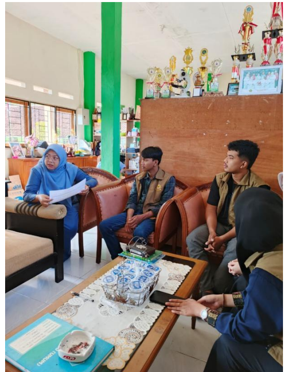
Gambar 2 Wawancara pihak sekolah

praga yang tidak beraturan, membuat perpustakaan terlihat sangat tidak nyaman. Adapun sub masalah dapat dilihat dari 1) keterbatasan koleksi buku yang kurang relevan dengan kebutuhan pembelajaran maupun pengembangan literasi siswa, 2) kondisi pencahayaan yang kurang, cat dinding yang kurang mendukung, tata letak buku yang tidak beraturan, rak-rak buku yang tidak memadai, membuat kondisi ruangan kurang menarik, 3) rendahnya intensitas kegiatan literasi, seperti pojok baca, resensi buku, atau program literasi terjadwal, sehingga pemanfaatan perpustakaan sebagai pusat kegiatan akademik maupun non-akademik untuk menjangkit kreativitas siswa belum optimal, 4) keterbatasan dana dan anggaran membatasi kemampuan sekolah dalam melakukan renovasi atau pengembangan tata ruang. Berikut ini merupakan dokumentasi hasil identifikasi dan pemetaan masalah.