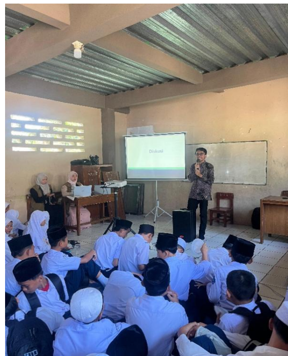
Gambar 7 Penyuluhan Literasi

Penyuluhan literasi dan pelatihan pengelolaan perpustakaan menjadi bagian penting dari implementasi program karena tidak hanya berfokus pada perbaikan fisik, tetapi juga pada penguatan aspek sumber daya manusia dan keberlanjutan program. Menurut konsep capacity building dalam manajemen pendidikan, peningkatan kompetensi individu maupun kelompok akan memperkuat efektivitas serta kesinambungan suatu program (Suherman, et al., 2023). Adapun dokumentasi kegiatan ini sebagai berikut: