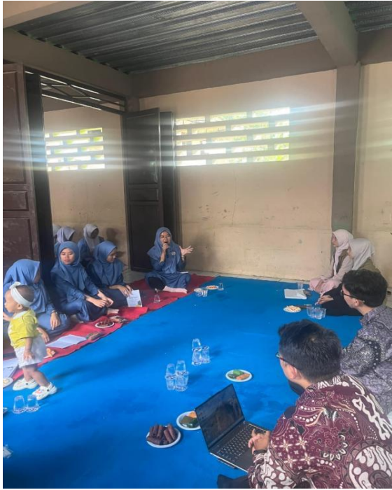
Gambar 8 Pelatihan Pengelolaan Perpustakaan