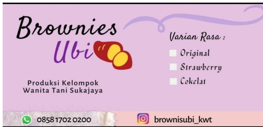
Gambar 1. stiker kemasan

Berikut Logo kemasan produk-produk yang akan di buat.