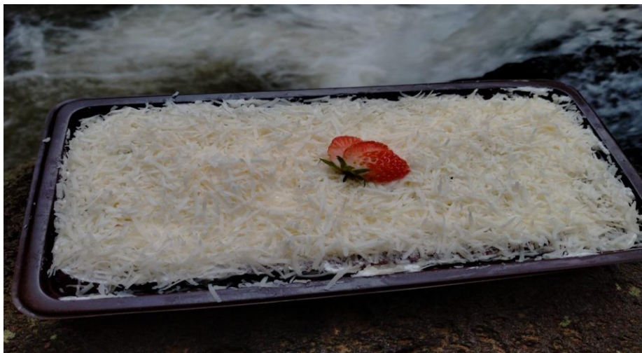
Gambar 2. brownies yang siap dipasarkan