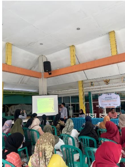
Gambar 4. Sosialisasi Proses Sertifikasi Halal.

usai, berlanjut pada sesi penutup yang merupakan bagian akhir dari rangkaian acara ini. Pada sesi penutup, pemateri dan mahasiswa menyampaikan ucapan terimakasih pada para pelaku UMKM dan Ibu PKK yang telah berpartisipasi dalam program ini (Mohd Nor & Hassan, 2022).