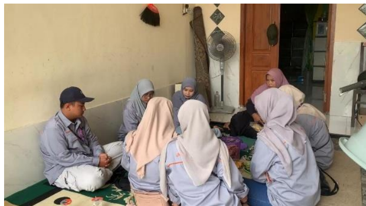
Gambar 1. Pemberian Edukasi Sertifikasi Halal

Pada sesi ini, para Mahasiswa memberikan edukasi kepada pelaku UMKM Dapur Bu Hadi mengenai pentingnya sertifikasi halal sebagai instrumen strategis dalam menjamin kualitas dan keamanan produk, sekaligus sebagai bentuk kepatuhan terhadap regulasi yang berlaku. Edukasi ini dirancang untuk meningkatkan pemahaman mitra usaha terkait urgensi sertifikasi halal, tidak hanya dari perspektif normatif keagamaan, tetapi juga dari sudut pandang hukum, ekonomi, dan keberlanjutan usaha (Hafizi & Athar, 2024). Dalam pemaparannya, mahasiswa menjelaskan bahwa sertifikasi halal merupakan bagian dari sistem jaminan produk yang dikelola oleh Badan Penyelenggara Jaminan Produk Halal (BPJPH), yang bertujuan memberikan kepastian hukum atas kehalalan suatu produk. Penjelasan ini mencakup dasar regulasi, prosedur pengajuan sertifikasi, serta konsekuensi administratif apabila pelaku usaha belum memenuhi kewajiban sertifikasi sesuai ketentuan yang berlaku. Dengan demikian, pelaku UMKM memperoleh pemahaman yang komprehensif mengenai posisi sertifikasi halal dalam sistem hukum nasional.