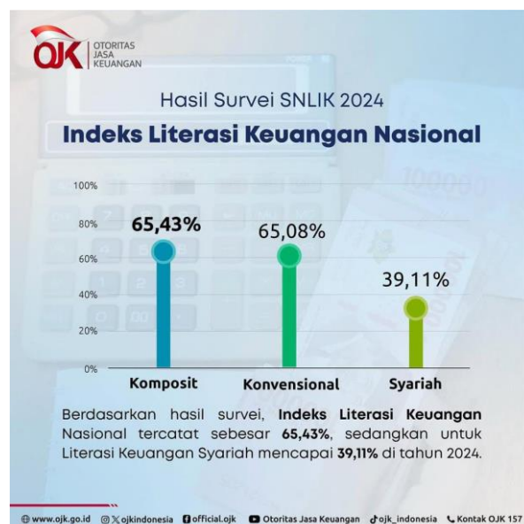
Gambar 1. Hasil Survei SNLIK 2024

Menurut hasil Survei Nasional Literasi dan Inklusi Keuangan (SNLIK) 2024 yang dirilis Otoritas Jasa Keuangan (OJK), tingkat literasi keuangan masyarakat Indonesia tercatat sebesar 65,43%. Dari jumlah tersebut, literasi keuangan konvensional berada pada angka 65,08%, sementara literasi keuangan syariah masih relatif rendah, yakni 39,11% (OJK, 2024). Data tersebut menunjukkan bahwa pemahaman masyarakat terhadap konsep keuangan syariah masih relatif rendah. Untuk menjawab tantangan ini, OJK telah mendorong berbagai program, salah satunya melalui Simpanan Pelajar (SimPel) yang mengajak pelajar agar lebih gemar menabung sejak dini dengan tujuan meningkatkan inklusi keuangan (Medcom, 2024).