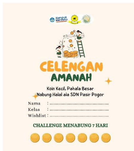
Gambar 2. Form Celengan Amanah

Pelaksanaan program diawali dengan pertemuan pertama yang berfokus pada edukasi interaktif tentang pentingnya menabung secara halal dan amanah. Siswa diperkenalkan pada perbedaan dasar antara keuangan syariah dan konvensional dengan bahasa sederhana yang kontekstual. Untuk memperkuat pemahaman, siswa diberi Form Celengan Amanah yang berfungsi sebagai catatan harian kebiasaan menabung, serta ditugaskan untuk membuat celengan sederhana dari bahan daur ulang di rumah. Dengan pendekatan pembelajaran kontekstual, siswa dapat langsung mengaitkan konsep literasi keuangan syariah dengan rutinitas harian siswa, sehingga materi yang diajarkan lebih mudah dipahami dan memiliki arti bagi mereka (Budiman, 2022 dalam Aura Yolanda et al., 2024).