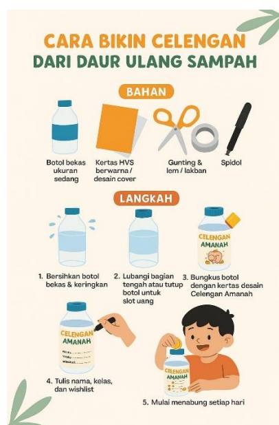
Gambar 3. Poster Cara Membuat Celengan Amanah dari Daur Ulang Sampah