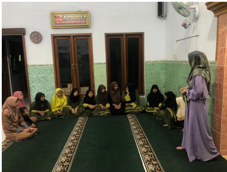
Gambar 2. Pelaksanaan Pengabdian Masyarakat

Program pengabdian ini menunjukkan bahwa literasi fintech tidak hanya berperan dalam aspek ekonomi, tetapi juga menjadi instrumen preventif terhadap gangguan kesehatan mental akibat jeratan pinjaman online ilegal. Keberhasilan program ini menjadi dasar penting untuk mereplikasi model serupa di wilayah lain yang mengalami permasalahan serupa. Sinergi antara literasi finansial dan pengetahuan untuk mengatasi kecemasan membentuk fondasi preventif yang kokoh, peserta tidak hanya lebih bijak secara finansial, tetapi juga lebih tangguh secara emosional dalam menghadapi tekanan ekonomi digital.