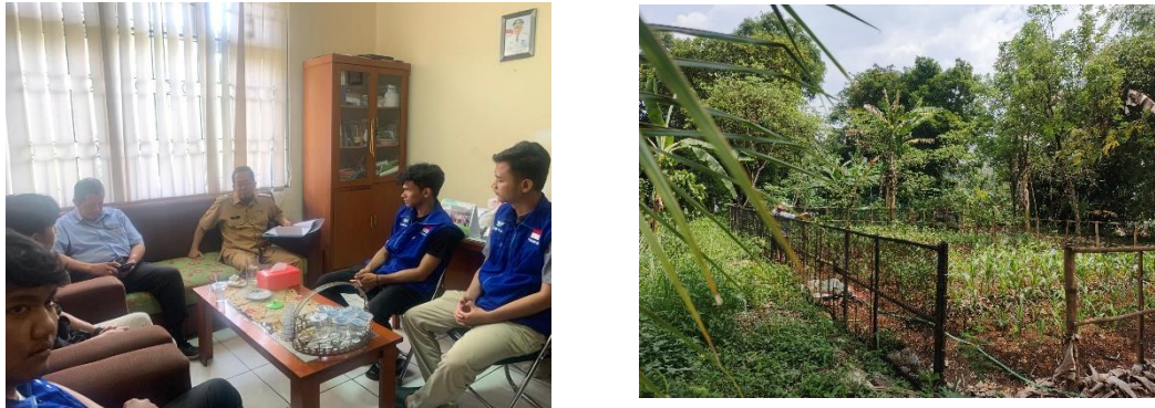
Gambar 2. Sosialisasi dan Identifikasi Lahan

perekonomian lokal, serta memberikan dampak positif bagi masyarakat sekitar, baik dari segi ekonomi, sosial, maupun lingkungan. Melalui budidaya bunga telang yang dimulai dari lahan kosong yang sebelumnya tidak produktif, masyarakat desa dapat memanfaatkan sumber daya alam yang ada dengan cara yang lebih produktif dan berkelanjutan. Berikut dokumentasi kegiatan sosialisasi dan identifikasi lahan.