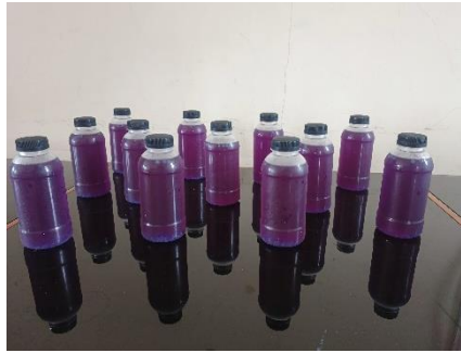
Gambar 3. Inovasi Budidaya Bunga Telang

Pada gambar 3 merupakan hasil dari pengolahan bunga telang yang dijadikan minuman segar yang dinamai bluebliss tea . Perpaduan antara bunga telang dan air gula serta soda yang dapat dijadikan minuman segar bagi setiap kalangan diusia muda maupun tua. Potensi alam dan ekonomi desa di Kelurahan Menteng ini memiliki potensi alam yang sangat mendukung berawal dari lahan kosong yang berada RW 15. Diawali dengan berbagai bumbu dapur seperti jahe, kunyi, dan baya. Selanjutnya mempunyai ide atau inisiatif dalam memperkenalkan bunga telang ini kepada masyarakat sekitar karena mempunyai manfaat dan khasiat yang sangat besar. Dengan kondisi tanah yang subur dan iklim yang mendukung, masyarakat dapat memanfaatkan sumber daya alam yang tersedia untuk mengembangkan usaha berbasis tanaman herbal ini yang termasuk teh bunga telang ( bluebliss tea ).