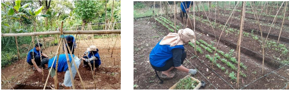
Gambar 3. Budidaya Bunga Telang

Pada budidaya bunga telang relatif mudah dan tidak membutuhkan perhatian khusus, langkah-langkah budidayanya antara lain: