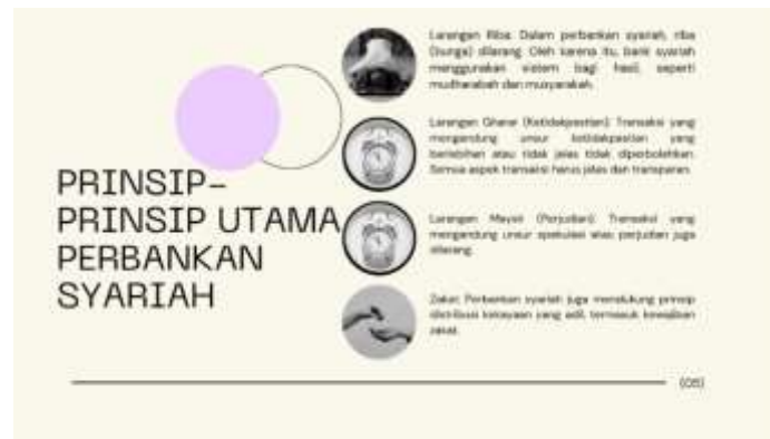
Gambar 2. Materi Dasar Perbankan Syariah

Kegiatan selanjutnya setelah dilakukan penyampaian materi dasar perbankan syariah para peserta prapen diberikan pemahaman terkait istilah dalam dunia perbankan syariah serta kosakata bahasa Inggris terkait perbankan syariah. Berikut adalah tabel daftar istilah asing yang sering digunakan dalam perbankan syariah;