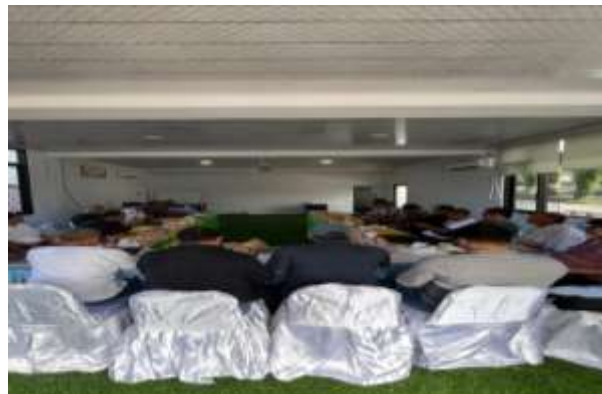
Gambar 4. Sesi Diskusi dan Tanya Jawab

Selanjutnya, peserta pra-pensiun diarahkan pada dua sesi terakhir yaitu sesi diskusi, tanya jawab dan studi kasus terkait simulasi produk syariah bagi peserta prapen. Contoh produk perbankan syariah dengan tujuan khusus yaitu nasabah prapen adalah BSI Pra pensiun Berkah yang terfokus pada pelayanan pembiayaan dari Bank Syariah Indonesia (BSI) untuk produk konsumtif atau non-produktif nasabah. Pada sesi ini, para peserta diberikan wawasan dan edukasi cara mengelola dana pensiun dengan baik sesuai syariat islam. Berikut adalah contoh pamflet produk yang maksud pada gambar 5.