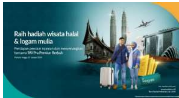
Gambar 5. Contoh Pamflet Produk Perbankan Syariah

Pada sesi ini, dilakukan pula wawancara singkat terkait pemahaman para peserta prapen sesuai materi yang telah dipaparkan. Pada sesi simulasi dilakukan pula observasi singkat terhadap pengenalan produk perbankan syariah berdasarkan respon dan pemahaman peserta prapen. Evaluasi menunjukkan bahwa peserta merasa lebih percaya diri dalam menggunakan layanan perbankan syariah, terutama dalam hal pengelolaan dana pensiun mereka. Hasil wawancara singkat dengan peserta menunjukkan bahwa mereka merasa lebih siap untuk mengelola keuangan pribadi mereka menggunakan produk-produk perbankan syariah. Beberapa peserta menyatakan bahwa mereka akan lebih mempertimbangkan untuk membuka rekening di bank syariah atau berinvestasi dalam produk-produk keuangan syariah setelah memahami prinsip-prinsip yang ada.