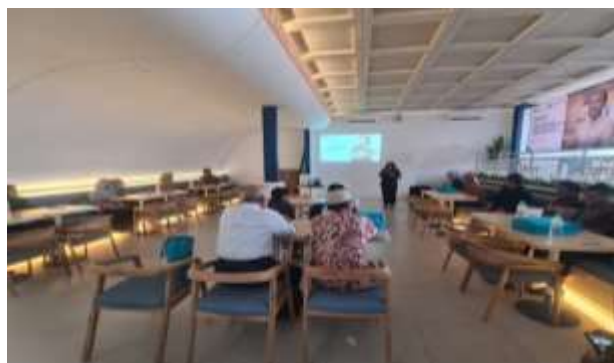
Gambar 3. Sesi Penyampaian Kosakata Asing

Pada sesi ini, peserta diberikan edukasi menggunakan media power point terkait istilah asing tersebut diatas dengan harapan agar lebih mudah dalam mencerna informasi produk perbankan syariah yang ditawarkan.