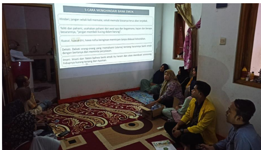
Gambar 2. Kegiatan Pengabdian di RW 11 Ciakar