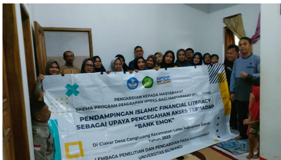
Gambar 3. Foto Bersama