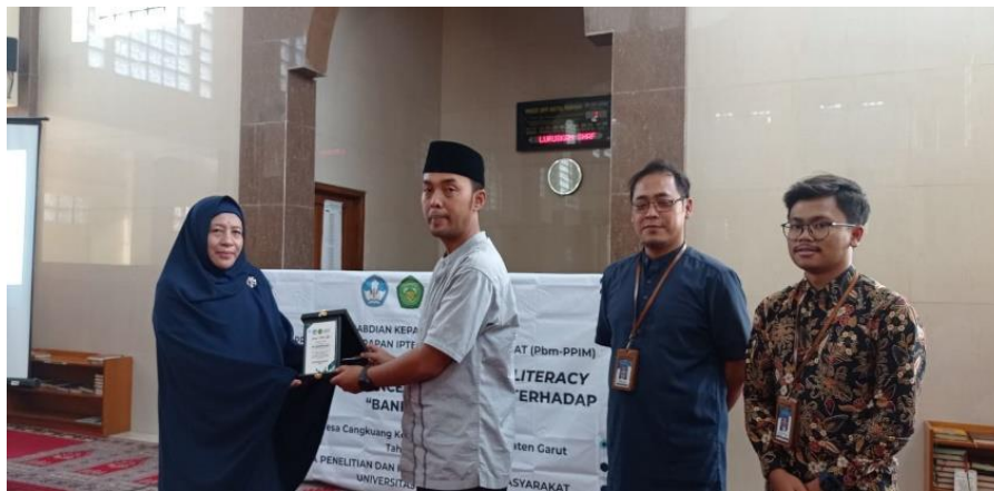
Gambar 1. Kegiatan Pengabdian di Masjid Baitul Manan