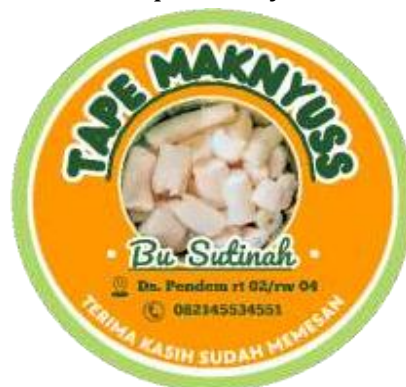
Gambar 3. Desain label untuk produk UMKM tape singkong

Pembuatan desain label oleh tim KKN UNISNU Jepara Desa Pendem memanfaatkan website desain Canva. Hasil desain label sepenuhnya menjadi hak milik Ibu Sutinah. Sebelumnya produk milik Ibu Sutinah ini belum memiliki merk, sehingga Tim KKN UNISNU Jepara Desa Pendem berinisiatif memberikan nama produk tape singkong dengan nama "Tape Maknyus Bu Sutinah".