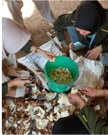
Gambar 4. Proses pengupasan dan pemotongan singkong