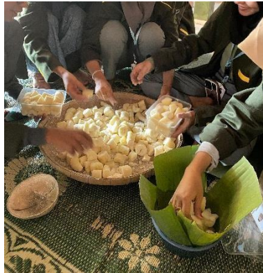
Gambar 7. Proses peragian dan pengemasan produk