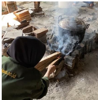
Gambar 6. Proses perebusan singkong