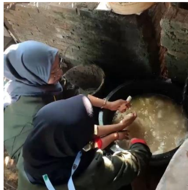
Gambar 5. Proses pencucian