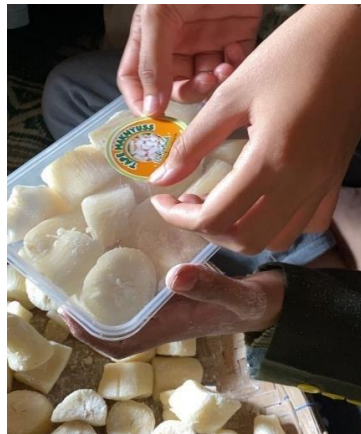
Gambar 8. Proses pemasangan label pada kemasan produk

Dengan adanya kegiatan pengabdian ini, UMKM tape singkong Ibu Sutinah memberikan respon yang positif. Kemasan baru dan pemberian label pada produk membuktikan mampu meningkatkan penjualan "Tape Maknyus Bu Sutinah". Selain itu, pemberian nama atau merk pada produk menjadi identitas yang membedakan dengan tape singkong lainnya. Setelah kegiatan pendampingan ini, penjualan tape singkong milik Ibu Sutinah meningkat sebanyak 30% (tiga puluh persen). Tim KKN UNISNU Desa Pendem juga memberikan kuesioner sebagai bahan evaluasi pelaksanaan program pengabdian masyarakat ini dan mendapat 80% tanggapan sangat puas dari mitra. Oleh karena itu, harapannya inovasi yang telah dilakukan oleh tim KKN dapat terus dikembangkan dan dimanfaatkan sebaik mungkin demi meningkatkan ekonomi pelaku UMKM di Desa Pendem.