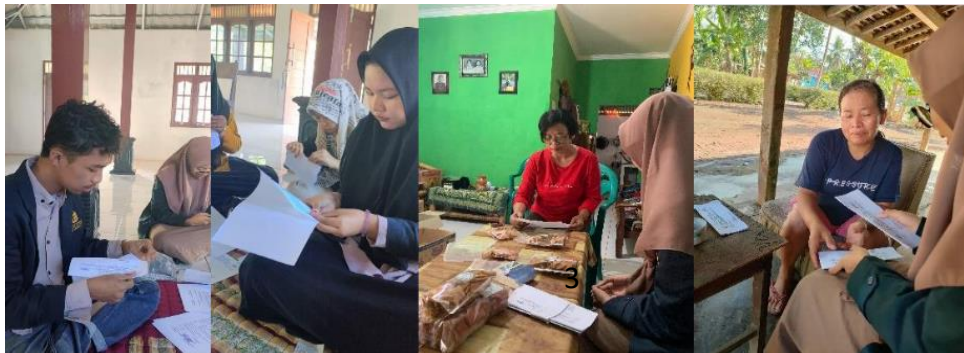
Gambar 1. Persiapan Kegiatan

(Syafitri et al., 2022). Kemudian kami mengundang para pelaku UMKM untuk mengikuti sosialisasi terkait sertifikasi halal dengan narasumber yang sudah ahli dalam bidang tersebut. Setelah para UMKM memahami bagaimana pentingnya serta bagaimana proses untuk sertifikasi halal, maka selanjutnya kami melakukan pendampingan penyusunan dokumen pendaftaran halal yang diajukan melalui system SI HALAL dengan laman https://ptsp.halal.go.id/ (Hartati et al., 2022). Setelah mengisi biodata dan proses produksi dengan lengkap, maka dokumen akan terkirim ke Badan Penyelenggara Jaminan Produk Halal (BPJPH) yang mana akan diputuskan oleh FATWA MUI untuk keputusan halal pada kualitas produknya (Hamidah, 2022). Proses pengajuan ini membutuhkan waktu sekitar satu hingga beberapa bulan karena menunggu banyaknya antrian para pelaku UMKM yang berkeinginan membuat sertifikasi halal pada masing-masing produk.