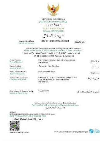
Gambar 4. Sertifikat Halal yang Terbit

Gambar 4 merupakan dokumen sertifikasi halal dari salah satu pelaku UMKM yang telah resmi kami buat, dan kini produk yang telah berjalan sudah bersertifikasi halal. Sehingga pelaku UMKM tidak perlu ragu dan khawatir ketika akan mengedarkan produknya ini karena telah resmi bersertifikasi halal dari Fatwa MUI dan sudah terjamin keamanannya bagi konsumen karena sudah sesuai dengan hukum nasional dan hukum islam (Warto & Samsuri, 2020). Sertifikasi halal berarti surat berupa keterangan yang dikeluarkan oleh MUI tentang halalness produk makanan, minuman, obat-obatan dan kosmetik yang telah diproduksi resmi dari sebuah perusahaan sehingga aman dan tidak termasuk dalam produk ilegal dan telah teruji klinis bagi kesehatan dan dinyatakan halal oleh LPPOM MUI. Pemerintah telah sepakat dengan merespon secara positif dan baik dengan pentingnya produk yang bersertifikasi halal melalui beberapa regulasi. Akan tetapi dari beberapa regulasi ini masih terkesan sektoral. Padahal, jenis pangan yang dibutuhkan manusia harus yang berstandar kualitas terjamin bagi setiap jenis produk yang diproduksi, sehingga masyarakat akan tetap aman, terjaga kesehatannya dan terjaminnya kesejahteraan seluruh rakyat Indonesia (Agus, 2017).