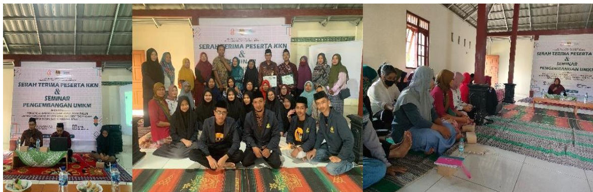
Gambar 2. Kegiatan Sosialisasi Sertifikasi Halal