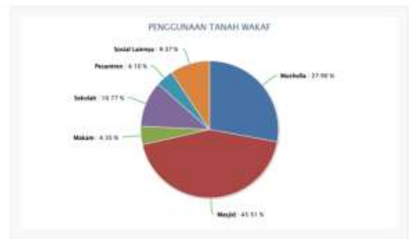
Gambar 1 Penggunaan Tanah Wakaf (SIWAK)

Masjid memiliki peran strategis dalam kehidupan umat Islam, tidak hanya sebagai tempat ibadah tetapi juga sebagai pusat kegiatan sosial dan ekonomi. Sejak zaman Rasulullah SAW, masjid telah menjadi pusat pembelajaran, musyawarah, dan berbagai aktivitas pemberdayaan umat. Namun, hingga saat ini, masih banyak masjid yang hanya berfungsi sebagai tempat ibadah tanpa memaksimalkan potensinya dalam meningkatkan kesejahteraan ekonomi masyarakat. Padahal, jika dikelola dengan baik, masjid dapat berperan dalam meningkatkan kesejahteraan umat melalui pengelolaan aset wakaf yang produktif.