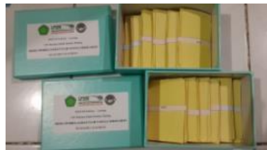
Gambar 6. Kartu soal