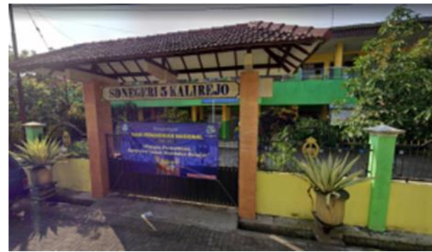
Gambar 1. SD Negeri 5 Kalirejo

Pengabdian ini dilaksanakan di SD Negeri 5 Kalirejo, Kelurahan Kalirejo, Kecamatan Lawang, Kabupaten Malang. SD yang berstatus sekolah negeri ini beralamat di Jl. Sumber Wuni Selatan No. 52 A, Lawang. (SD Negeri 5 Kalirejo, 2021).