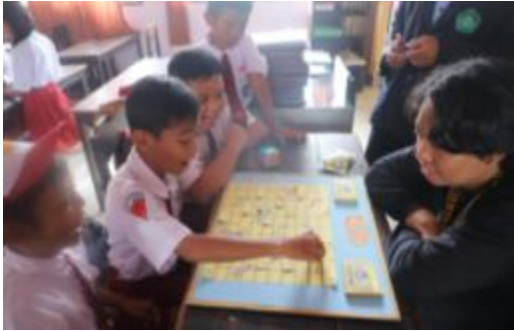
Gambar 8. Siswa bermain ular tangga dibimbing oleh mahasiswa KKM