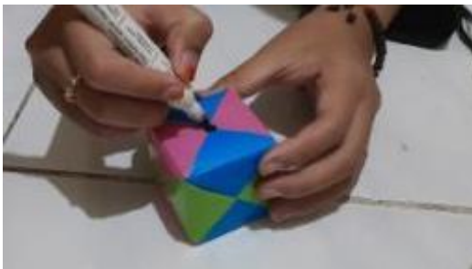
Gambar 5. Pembuatan dadu