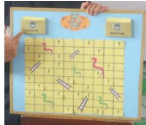
Gambar 7. Permainan UTS