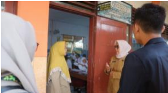
Gambar 2. Tim peneliti bersama mahasiswa KKM bertemu Kepala Sekolah SD Negeri 5 Kalirejo dan wali kelas 4B

Pada tanggal 6 Januari 2023, tim peneliti mendatangi SD Negeri 5 Kalirejo dalam rangka survei mengenai keadaan siswa-siswi SD Negeri 5 Kalirejo. Dari hasil survei, kami dipersilakan melaksanakan penelitian di kelas 4B pada hari Senin, 16 Januari 2023. Kelas 4B ini terdiri atas 27 siswa.