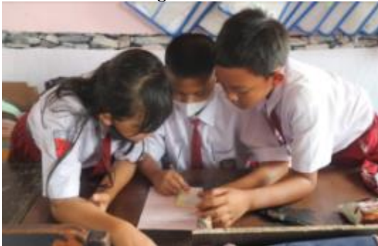
Gambar 9. Mahasiswa mendiskusikan jawaban kartu soal