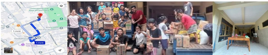
Gambar 1 Kondisi eksisting LKSA Simpang 3 Singaraja

Projek kepemimpinan merupakan mata kuliah yang bertujuan mengembangkan keterampilan kepemimpinan mahasiswa, khususnya dalam aspek perencanaan strategis, pengelolaan projek, dan kemampuan memimpin tim secara efektif dalam mencapai tujuan yang terukur (Grace Yulianti et al. , 2025; Hasanah et al. , 2023). Projek ini tidak hanya melatih mahasiswa dalam mengoordinasikan berbagai pemangku kepentingan, tetapi juga mempromosikan kolaborasi lintas sektor melalui keterlibatan aktif dengan komunitas lokal, lembaga sosial, dan masyarakat setempat (Saragi et al. , 2024). Salah satu manifestasi konkret dari program ini adalah pelaksanaan projek kepemimpinan di Lembaga Kesejahteraan Sosial Anak (LKSA) Simpang Tiga, Buleleng, Bali.