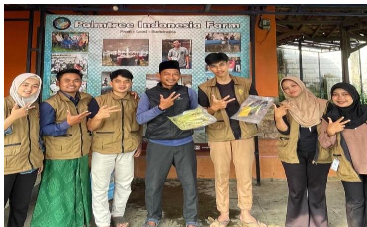
Gambar 2 Uji coba pembuatan frozen food

Hasil uji coba program membuktikan bahwa inovasi produk frozen food ikan nila bioflok mampu memberikan nilai tambah yang signifikan bagi sektor perikanan desa. Selama ini para pembudidaya di Desa Wates Jaya cenderung hanya menjual ikan nila dalam bentuk segar dengan margin keuntungan yang relatif kecil. Kondisi ini tentu membatasi peluang peningkatan kesejahteraan, mengingat persaingan pasar ikan segar sangat ketat dan harga seringkali berfluktuasi. Kehadiran produk olahan beku berbasis ikan nila memberikan solusi baru karena lebih kompetitif, bernilai jual lebih tinggi, sekaligus mampu menjawab kebutuhan pasar modern. Menurut penelitian, diversifikasi produk olahan ikan adalah solusi untuk meningkatkan nilai tambah produk mentah (Hartoyo et al., 2025). Hal ini juga sejalan dengan upaya untuk mengembangkan UMKM yang berbasis ekonomi kreatif (Fadillah, 2021). Dengan demikian, inovasi ini tidak hanya berfokus pada peningkatan keuntungan, tetapi juga berkontribusi pada pembangunan ekonomi lokal yang berkelanjutan (Wahyuni, Rianingsih, & Romadhon, 2021). Selain itu, penggunaan bumbu alami seperti kunyit, jahe, bawang putih, dan bawang merah tidak hanya memperkuat cita rasa, tetapi juga memberikan fungsi antimikroba dan antioksidan yang dapat memperpanjang umur simpan produk (Shahidi & Ambigaipalan, 2015).