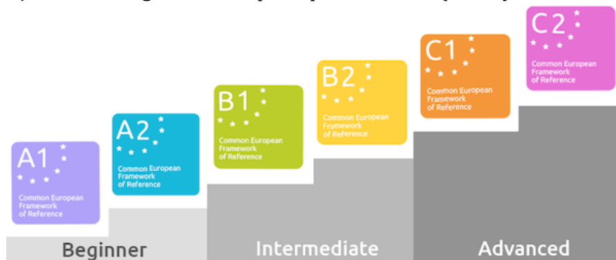
Gambar 1 Tingkatan level server

acuan untuk memetakan profil kompetensi setiap pembelajar. Keempat keterampilan tersebut dapat dikembangkan dalam berbagai bentuk sesuai dengan konteks pembelajaran dan tingkat kemampuan peserta didik (Sudaryanto & Widodo, 2020).