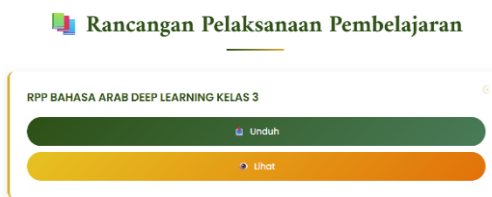
Gambar 1 RPP bahasa Arab berbasis CEFR

Dengan demikian pelatihan ini berhasil memenuhi tujuan pengabdian masyarakat, yaitu: