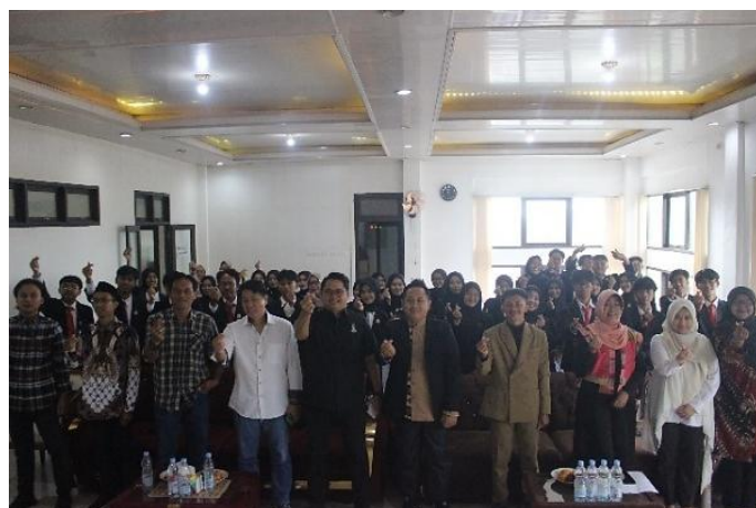
Gambar 2 Pelatihan dasar pencatatan transaksi harian

Tahapan implementasi partisipatif dalam kegiatan ini dilakukan secara bertahap dan bersamaan, dengan menekankan keterlibatan aktif pelaku UMKM selama proses pembelajaran dan penerapan sistem akuntansi sederhana. Tahap awal adalah pelatihan bertahap yang dibagi ke dalam tiga fase utama. Fase 1 dimulai dengan pelatihan awal yang mencakup pencatatan transaksi harian, seperti pencatatan pemasukan, pengeluaran, dan pengelolaan stok. Dalam pelatihan ini, pelaku UMKM diajarkan cara menggunakan buku kas sederhana yang mudah digunakan dan telah disesuaikan dengan situasi masing-masing usaha mereka. Tujuannya adalah untuk membiasakan pelaku UMKM mencatat setiap transaksi secara rutin sebagai dasar dalam pengelolaan keuangan.