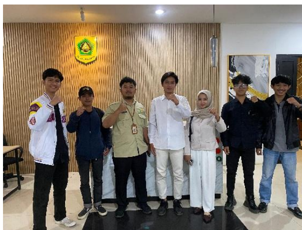
Gambar 3 Integrasi dengan lembaga local bumdes dan koperasi desa

Selanjutnya, modul pelatihan yang berasal dari konteks lokal dikembangkan dan tersedia secara langsung bagi pelaku UMKM, baik dalam bentuk cetak maupun versi elektronik, sebagai sarana pembelajaran berkelanjutan. Tahap ini juga melibatkan integrasi dengan lembaga lokal untuk memperkuat ekosistem praktik akuntansi berkelanjutan. Kemitraan dibangun dengan Badan Usaha Milik Desa (BUMDes) dan koperasi desa, yaitu institusi strategis di bidang ekonomi yang memiliki kapasitas operasional dan jaringan luas di tingkat lokal.