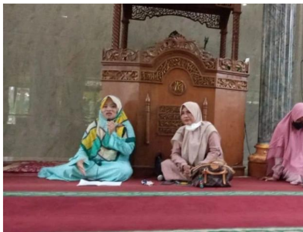
Gambar 2 Penyampaian ceramah

Kedua , etika sosial Islam dalam menjaga lisan, karena ghibah dan namimah merupakan dua perilaku lisan yang sangat berbahaya dalam etika sosial Islam karena dapat merusak kehormatan individu dan mengancam keharmonisan masyarakat. Dalam Islam, menjaga kehormatan sesama Muslim adalah kewajiban, dan menyebarkan aib atau memprovokasi permusuhan melalui lisan termasuk dosa besar. Ghibah, yaitu membicarakan keburukan orang lain di belakangnya meskipun benar, dan namimah, yaitu mengadu domba, keduanya dapat menyulut permusuhan, menghancurkan ukhuwah, dan menimbulkan perpecahan di tengah masyarakat. Nabi Muhammad Saw bahkan menyebut bahwa perilaku ini menjadi penyebab siksa kubur dan menggugurkan pahala kebaikan yang telah dilakukan. Bahaya lainnya adalah hilangnya kepercayaan antarindividu serta tersebarnya budaya fitnah dan prasangka buruk jika perilaku ini terus dibiarkan. Oleh karena itu, memahami dan menyampaikan hadis-hadis yang mencegah ghibah dan namimah sangat penting agar masyarakat, khususnya ibu-ibu di majlis ta'lim, mampu menciptakan kehidupan sosial yang sehat, harmonis, dan berlandaskan nilai-nilai akhlak Islam.