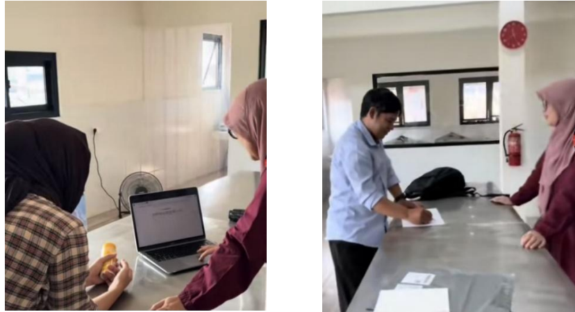
Gambar 2 Kegiatan pendampingan implementasi SJPH di PT MSB

Hasil asesmen menunjukkan bahwa mayoritas elemen SJPH belum dipenuhi secara optimal. Pihak manajemen dan karyawan belum memiliki pemahaman yang memadai terhadap persyaratan SJPH. Beberapa bahan baku yang digunakan teridentifikasi sebagai bahan kritis yang memerlukan verifikasi status kehalalannya. Selain itu, belum terdapat sistem dokumentasi untuk aktivitas operasional harian, sementara proses produksi masih dijalankan berdasarkan instruksi lisan tanpa pencatatan. Dari aspek legalitas, PT MSB telah memiliki Nomor Induk Berusaha (NIB), namun belum memperoleh izin edar dari BPOM, yang merupakan persyaratan penting untuk pendaftaran produk ke dalam sistem SIHALAL milik BPJPH.