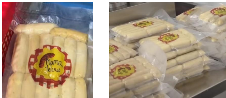
Gambar 4 Produk sosis Mamalelow

Produk yang akan disertifikasi harus didata secara lengkap dan memenuhi persyaratan SJPH, termasuk nama, bentuk, desain kemasan, dan profil sensori yang tidak mengandung unsur haram, kufur, atau simbol ibadah agama lain (Jumiono & Rahmawati, 2020). Setiap produk wajib memiliki formula baku yang disahkan oleh pimpinan perusahaan dan digunakan sebagai acuan dalam proses produksi, dengan seluruh bahan yang digunakan telah tercantum dalam Daftar Bahan Halal. Penggunaan bahan di luar formula atau yang tidak terdaftar tidak diperbolehkan. Untuk mendukung transparansi dan ketelusuran, disusun diagram alir proses produksi serta matriks bahan terhadap produk yang menggambarkan komposisi masing-masing produk secara rinci.