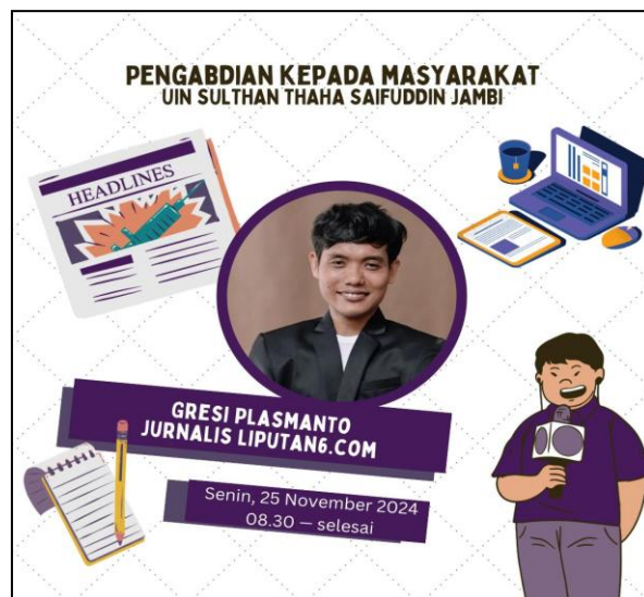
Gambar 1 Poster kegiatan pengabdian

Secara keseluruhan, kegiatan pelatihan ini sangat bermanfaat bagi peserta, karena tidak hanya memperkaya wawasan mereka tentang dunia jurnalisme, tetapi juga memberikan pengalaman langsung dalam proses pembuatan berita yang profesional dan berkesan. Diharapkan, dengan adanya pelatihan seperti ini, peserta dapat menerapkan ilmu yang diperoleh dalam karier mereka di dunia media atau sebagai penulis berita. Berikut adalah poster kegiatan sesi kesatu.