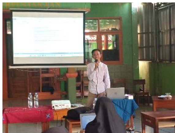
Gambar 3 Demonstrasi perancangan RPP dan Modul Ajar

Setelah sesi ceramah, dilakukan metode demonstrasi untuk menunjukkan langkah-langkah praktis dalam menyusun RPP dan modul ajar. Pemateri memberikan contoh nyata dari setiap komponen perangkat ajar, seperti merumuskan Alur Tujuan Pembelajaran (TP) dari Tujuan Pembelajaran, menyusun langkah-langkah pembelajaran yang melibatkan siswa dan membuat asesmen yang sesuai dengan tujuan yang telah disusun. Demonstrasi ini dirancang agar peserta dapat melihat secara langsung bagaimana teori diterapkan ke dalam praktik.