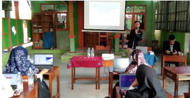
Gambar 2 Penyampaian teori melalui ceramah

penjelasan RPP, perbedaannya dengan modul ajar dan komponen-komponen yang harus dipenuhi dalam menyusunnya. Ceramah ini menggunakan media presentasi interaktif yang membantu peserta memahami teori dengan lebih jelas dan terstruktur.