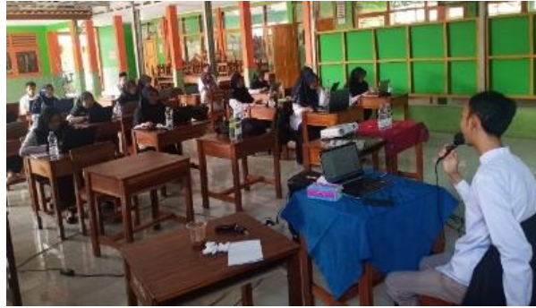
Gambar 4 Praktik langsung merancang RPP dan Modul Ajar

Selama proses praktik, pemateri memberikan bimbingan intensif dan umpan balik kepada setiap peserta. Pendekatan ini membantu guru memperbaiki rancangan mereka sesuai dengan prinsip merancang Pembelajaran dan Asesmen. Pemateri juga mendorong diskusi di antara peserta, sehingga tercipta suasana kolaboratif yang memungkinkan guru untuk saling bertukar ide dan solusi. Hal ini memperkuat pemahaman dan meningkatkan motivasi peserta dalam menyelesaikan tugas mereka. Hasil dari kegiatan pendampingan ini menunjukkan peningkatan yang signifikan dalam kemampuan guru. Sebagian besar peserta berhasil menyusun RPP dan modul ajar yang sesuai dengan prinsip merancang Pembelajaran dan Asesmen. Guru juga mampu mengadaptasikan pengalaman mengajarnya dalam menyusun langkah-langkah pembelajaran. Selain itu, pendampingan ini meningkatkan kepercayaan diri guru dalam merancang pembelajaran yang kreatif dan kontekstual.