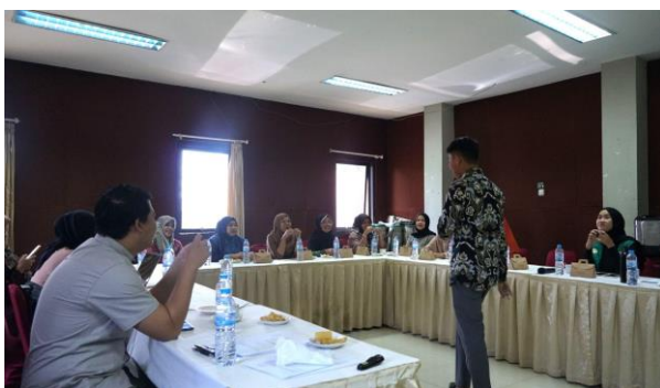
Gambar 2. Pemaparan materi dan diskusi Manajemen Kualitas Produksi

Pelatihan yang dilakukan menerapkan prinsip-prinsip andragogi, peserta pelatihan tidak hanya menerima secara pasif tetapi juga dilibatkan secara langsung dalam setiap proses pelatihan. Pelatihan yang dilakukan juga menerapkan metode pre-test dan post-test untuk melihat sejauh mana peningkatan pemahaman dan keterampilan para peserta pelatihan (Banuwa & Susanti, 2021).