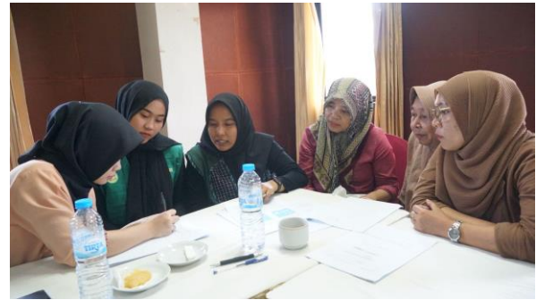
Gambar 3. Praktik penyusunan Standar Operasional Prosedur (SOP)

Pelatihan ini telah berhasil meningkatkan kualitas dan efisiensi proses produksi. Melalui pelatihan dan pendampingan yang telah dilakukan, UMKM DariDiri berhasil menyusun dan menerapkan SOP. Penerapan SOP yang dilakukan oleh UMKM DariDiri dalam proses produksi mampu mengurangi tingkat kesalahan produksi dari 15% menjadi 10%. Penurunan tingkat kesalahan tersebut membuat proses produksi menjadi lebih berkualitas dan efisien. Hal ini menggambarkan pentingnya penerapan SOP untuk meningkatkan efisiensi dan konsistensi operasional (Rahmawati & Nazhifah Suryana, 2024).