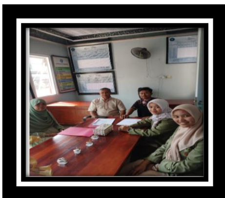
Gambar 2 Diskusi Persiapan Pelatihan Bersama BUMDES dan Perwakilan Desa Wates Jaya

Kegiatan pelatihan yang dilakukan pada kali ini bertujuan sebagai pembekalan bagi UMKM untuk melakukan kegiatan branding image untuk masing-masing produk yang mereka hasilkan. Kegiatan pelatihan dilakukan pada tanggal 10 Agustus 2024 mulai dari pukul 08.00 sampai dengan pukul 15.00 di Lido Lake Resort by MNC, Jl. Raya Bogor Sukabumi No. KM 21 Desa Wates Jaya Kec. Cigombong Kabupaten Bogor. Kegiatan pelatihan diawali dengan kegiatan diskusi bersama dengan pihak Bumdes dan Desa wates Jaya. Kegiatan ini dilakukan pada tanggal 31 Juli 2024 yang dihadiri oleh perwakilan BUMDES dan perwakilan dari pihak desa.