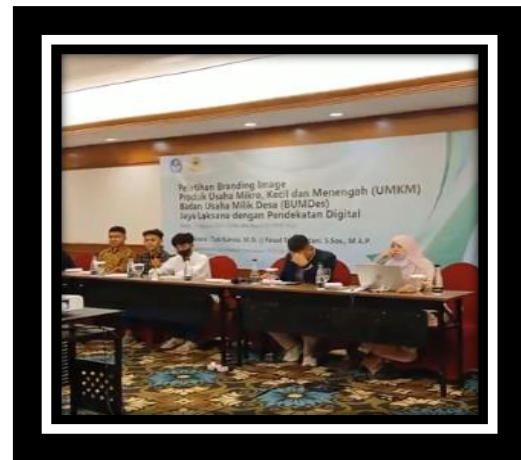
Gambar 4 Kegiatan Pelatihan Branding Image

video-video untuk produknya. Hasil video dikirimkan kepada panitia untuk diberikan penilaian.