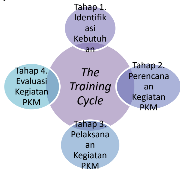
Gambar 2. Tahapan Pengabdian

Pelaksanaan kegiatan pengabdian masyarakat ini menggunakan pendekatan Training Cycle , yang terdiri dari tahapan-tahapan sebagai berikut: identifikasi kebutuhan pelatihan, penetapan tujuan dan perencanaan pelatihan, pelaksanaan pelatihan, dan yang terakhir adalah evaluasi. Berikut ini adalah ilustrasi yang mewakili pendekatan Siklus Pelatihan tersebut.