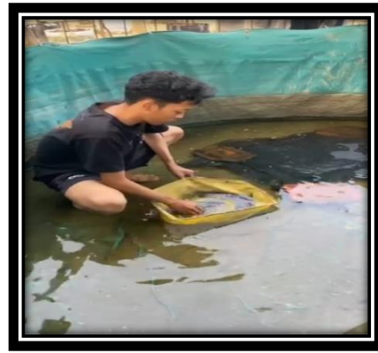
Gambar 2. proses pemijahan

Pemijahan dilakukan secara alami pada kolam terpal bundar dengan diameter 2x2 m. Kolam yang akan digunakan untuk pemijahan dicuci dan dikeringkan terlebih dahulu, setidaknya 1 hari sebelum digunakan. Kolam yang kering selanjutnya diisi dengan air sebanyak 30 cm. selanjutnya kolam yang sudah terisi air, diberi waring (jaring hitam) yang ditindih dengan genting pada tiap sudutnya. Hal ini dilakukan agar lele merasa nyaman atau tidak stres dalam proses pemijahan dan sebagai tempat menaruh telur hasil dari pembuahan. Tingkatan keagalam dalam pemijahan alami sedikit lebih tinggi daripada teknik lainnya (Kusuma et al., 2019)