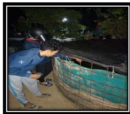
Gambar 3. Pengecekan kolam ikan

Proses pembenihan berlangsung setelah telur yang dihasilkan menetas. Telur menetas pada umumnya setelah 1x24 jam setelah keluar dari ikan. Pada tahapan pembenihan ini perlu perhatian khusus, dari