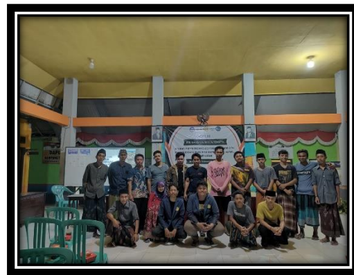
Gambar 4. Tim Memberikan Materi budidaya ikan lele.

Permasalahan harga pakan yang cukup tinggi dan menghabiskan separuh dari total biaya produksi diperlukan solusi ataupun strategi yang bisa mengatasi hal tersebut. Seperti halnya pembuatan pakan sendiri ataupun penambahan probiotik yang dimana probiotik yang dapat membantu laju pertumbuhan ikan dapat mengefisienkan jumlah pakan yang diberikan (Dara et al. , 2022).