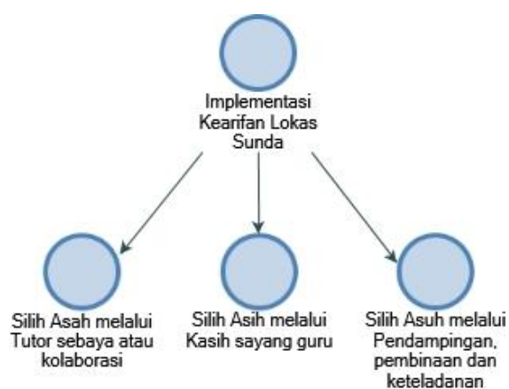
Gambar 3 Hasil Penelitian Implementasi Kearifan Lokal

Adapun temuan kedua penelitian ini yaitu penguatan karakter siswa diperkuat melalui implementasi kearifan lokal Sunda yang dikenal dengan konsep Silih Asah , Silih Asih , dan Silih Asuh . Temuan ini meliputi Silih Asah melalui Tutor sebaya atau kolaborasi, Silih Asih melalui Kasih sayang guru, Silih Asuh melalui Pendampingan, pembinaan dan keteladanan. Hasil ini dapat dilihat lebih jelasnya dalam visualisasi gambar Nvivo di bawah ini: