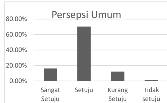
Gambar 3 Grafik persepsi umum Pendidikan inklusif

praktik Pendidikan inklusi di satuan PAUD. Dimana 14,46% menyatakan sangat Setuju, 71,60% menyatakan Setuju, 12,24% menyatakan kurang Setuju dan 1,70% menyatakan tidak Setuju.