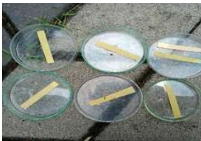
Gambar 2. Hasil Uji Boraks

Pada uji boraks ini masing-masing sampel terasi tersebut ditambahkan dengan Reagen sebanyak 4-6 tetes, setelah itu dihomenkan. Jika sudah homogen kertas kurkumin dicelupkan \frac{1}{2} kedalam sampel, setelah itu kertas kurkumin dikeringkan dibawah sinar matahari selama 10 menit. Jika kertas kurkumin berubah warna menjadi merah kecoklatan maka sampel tersebut mengandung boraks. Pada reaksi antara boraks dan kertas kurkumin yang menghasilkan ikatan rosocyanin ( B[C_{12}H_{20}O_6]_2Cl ) berwarna merah bata (Susanti, 2024). Kurkumin yang terdapat dalam kunyit dapat memecah boraks menjadi asam borat, lalu membentuk kompleks rosocyanin berwarna merah kecoklatan dalam kondisi asam. Hal ini menyebabkan perubahan warna menjadi merah oranye hingga merah pada makanan yang mengandung boraks (Permatasari et al. , 2023). Seperti yang terdapat pada gambar berikut :