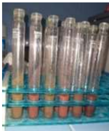
Gambar 4. Hasil Uji Formalin pada Sampel Terasi

Pada uji tes kit formalin terjadi adanya perubahan warna karena adanya reaksi seperti gambar 3 hasil yang didapatkan pada pengujian boraks pada sampel terasi dapat dilihat pada gambar berikut :