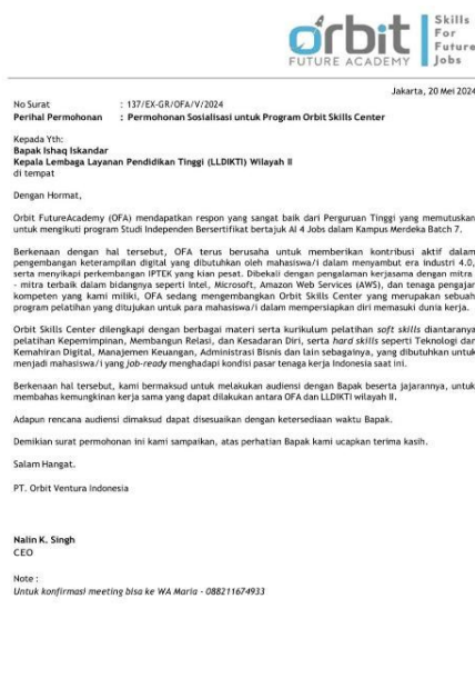
Gambar 1 Surat Rekomendasi

kesesuaian kata yang digunakan. Pemeriksaan ini juga merupakan hal yang penting untuk memastikan bahwa surat yang akan dikirimkan ke LLDikti memiliki kualitas yang baik dan mencerminkan citra positif dari Orbit Future Academy itu sendiri. Proses ini lumayan memakan waktu karena penulis harus menunggu persetujuan dan perbaikan dari mentor sebelum surat dapat dianggap final. Berikut merupakan salah satu dari 17 contoh surat rekomendasi LLDikti yang dibuat: