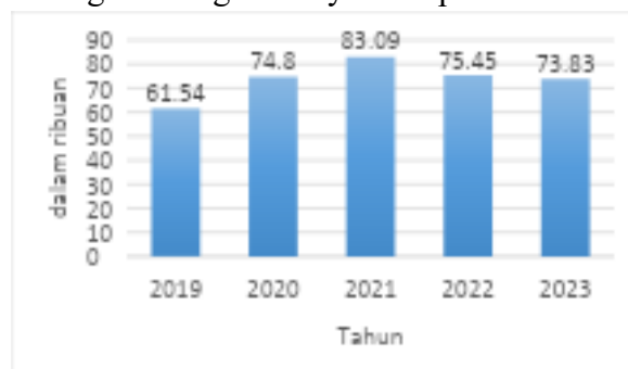
Gambar 1. Jumlah Penduduk Miskin Kabupaten Serang 2019-2023

Berdasarkan tabel 1 pada Maret 2022 dan Maret 2023 daerah Pedesaan masih mendominasi catatan Penduduk miskin yang dipublikasi oleh Badan pusat Statistik Indonesia, namun pada Maret 2023 persentase menurun sebesar 0,18% terhadap Maret 2022. Pendapatan kapita per bulan masyarakat perkotaan pada dua tahun terakhir masih unggul dibandingkan dengan masyarakat pedesaan.